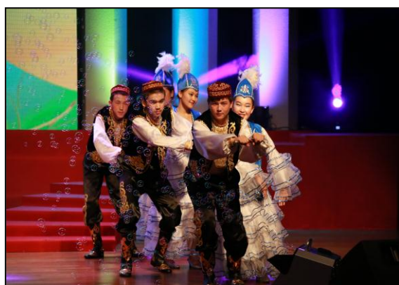
课外社团的同学在演出

针对新疆班学生能歌善舞的特点，学校开展了一系列开放型教育活动，最有代表性的是课外社团。同学们自主召集、自我管理，学校投入资金，提供场地与器材，聘请上海大学社团骨干和校外专业人士指导社团活动，在满足学生兴趣、培养学生特长以及创新素质方面，搭建平台。目前新疆部已形成包括科技、艺术、体育以及学科等社团共计 22 个。社团活动丰富了学生的课余时间，增进了同学间的交流，培养了同学们的领导才能，挖掘了他们的潜能。在上海市创新大赛、上海市民族联谊会、宝山国际民间艺术节、宝山区教师节庆祝大会、宝山区青春艺华等活动的演出中，他们的表现赢得了一致的好评。