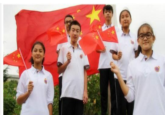
我的“中国梦”主题团日活动